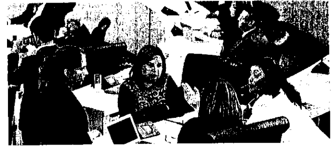
GUANAJUATO GTO.- A partir de este martes comenzará la glosa del Quinto Informe de Gobierno.

El Eje Guanajuato Seguro se analizará el miércoles 22 a las 10 de la mañana y será coordinada por la Secretaría de Gobierno. Además este eje están