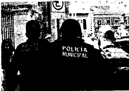
Los policías. Los elementos lesionados son de nuevo ingreso.

“Como no hay personal, nos mandan solos a los callejones, y en esos lugares nos encontramos con grupos de vándalos y es más difícil defendernos, además que algunos, como el compañero que apuñalaron y al que golpearon en el túnel, tienen contrato eventual y por eso no portan arma de fuego”, comentó uno de los uniformados.