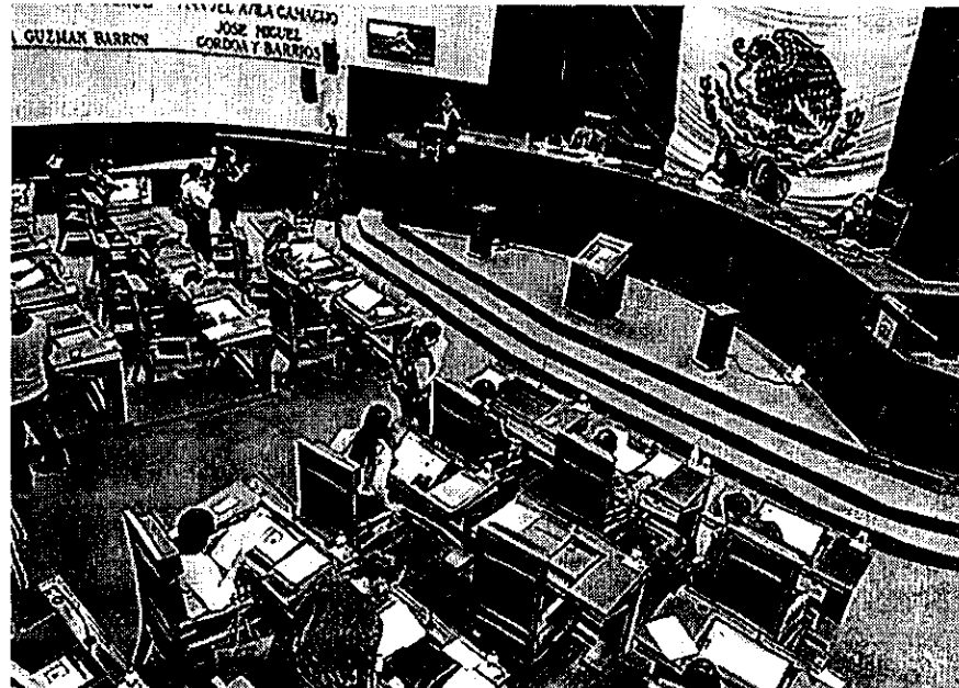
SEÑALA ESTUDIO que en 2015 el Congreso del Estado de Zacatecas fue el tercero que menor número de leyes y reformas aprobadas tuvo.

la Comisión de Régimen Interno y Concertación Política (CRIyCP) y la de Planeación, Patrimonio y Finanzas (PPF). La actual Legislatura aprobó una Comisión Especial, la del Centenario de la Constitución Política de los estados Unidos Mexicanos.