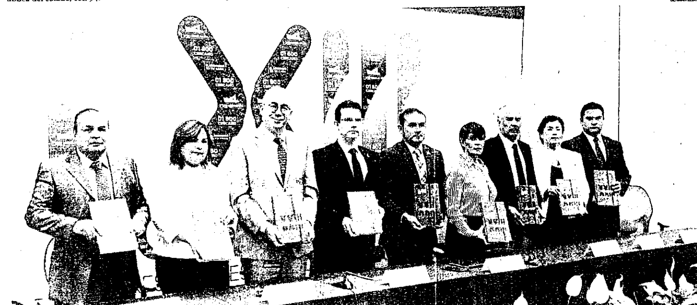
Raúl Montero de Alba presentó su Informe de actividades 2016 ante la Junta de Gobierno del Congreso del Estado.