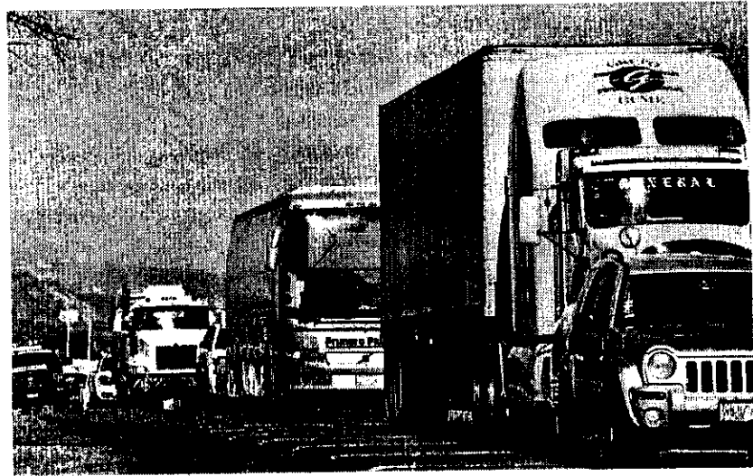
EN EL estado hay por lo menos cuatro carreteras conflictivas en incidencia de robo.

Sin embargo, dijo que el proceso de denuncia de robos es complejo, por lo que los transportistas optan por no hacerlo, pues es un día perdido el tramitarlo.