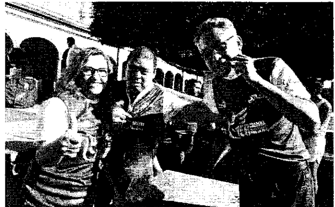
LA DIPUTADA Verónica Orozco, participa activamente en la realización de eventos deportivos.

Al término de la Carrera por la Paz se realizó la caminata canina con la firme intención de que todas las per-