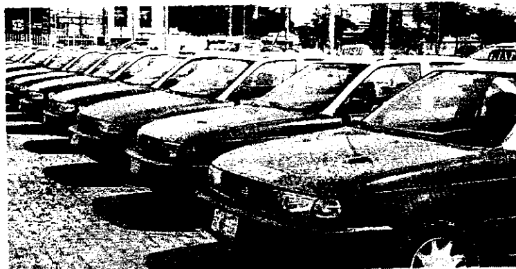
II El servicio se daba por medio una aplicación.

Lo declaró inválido por incumplir con la normatividad municipal